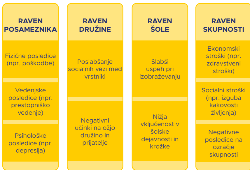
Slika 3: Posledice ustrahovanja.

zagotavlja razlago za ustrahovanje z dinamičnim in celostnim orisom, ki prikazuje medsebojno delovanje osebne ranljivosti, okoljskih stresorjev in vrednot okolja (npr. šole in skupnosti). 57 Ta zbirka orodij bo sledila ekološkemu okviru. Učinki ter dejavniki tveganja in zaščite bodo vsi kategorizirani glede na raven posameznika, družine, šole in skupnosti (glej sliko 3).