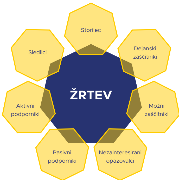
Slika 3: Krog ustrahovanja (po Univerza Clemson, 2003).